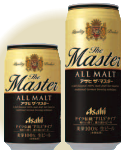
2009年5月26日発売 缶350ml、缶500ml 希望小売価格は設定していません

ドイツで長い歴史があり今でもドイツで最も飲まれている味わいと薫りが特長のピルスタイプビール。