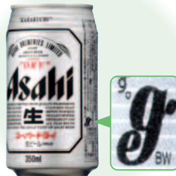
「アサヒ スーパードライ」缶350mlの缶体、6缶用包装資材、外箱には、グリーン電力を使用したことを示す「グリーン・エネルギー・マーク」を掲載します。

※2 グリーン電力：風力発電やバイオマス発電など、環境への負荷が小さい自然エネルギーによって発電された電力